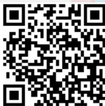
Googleマップでの アクセス方法