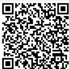
なかよし交流館HP サイト